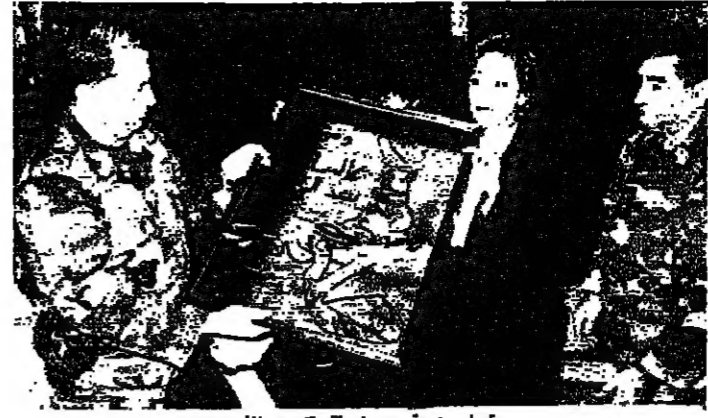
يتم تسليم هدية من لجنة تكريم الأب

شدد رئيس مجلس الوزراء العماد ميشال عون على أن التلاحم الموجود بين الجيش اللبناني والشعب اللبناني قوياً في شكل أن كل الإصبي من البعض لن تؤثر عليه. وقال إن مناعة الجيش والشعب ستغلب على كل الصعاب. مشيراً إلى أن إنجازات نواة الجيش في السنتين ٧٥ - ٧٦ جبرت على الميليشيات. وأوضح أنه لا يمكن التغلب إلا بالخروج من المؤامرة ومواجهتها.